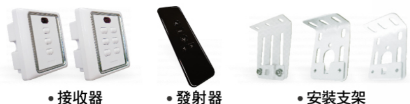
• 接收器 • 發射器 • 安裝支架