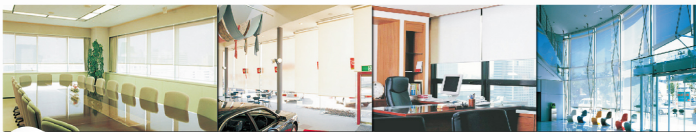
• 會議室 • 展示中心 • 辦公室 • 大廳

太平舟國際企業股份有限公司 總公司 ▶ 702台南市南區新義南路10號 www.jumbo-tech.com.tw TEL ▶ 06-2639399 FAX ▶ 06-2639688